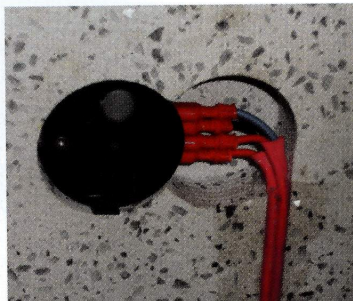
Détail sur la technologie embarquée dans un meuble de cuisine et sous le plan de travail.