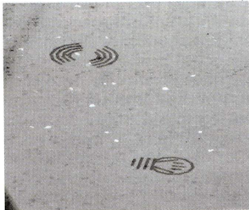
Deux gravures sur le plan permettent, de manière sensitive, de piloter l'ambiance lumineuse de la cuisine, avec deux fonctions on/off et variateur.

à développer son réseau de professionnels en démontrant que Tactea est une réelle source de valorisation de leur métier, une manière de se démarquer et de se rendre incontournable pour le cuisiniste. Les enjeux sont loin d'être anodins, sur un marché dont les évolutions fragilisent de plus en plus la position des professionnels de la pierre.